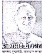
श्री अशोक गहलोत राजस्थान के मुख्यमंत्री